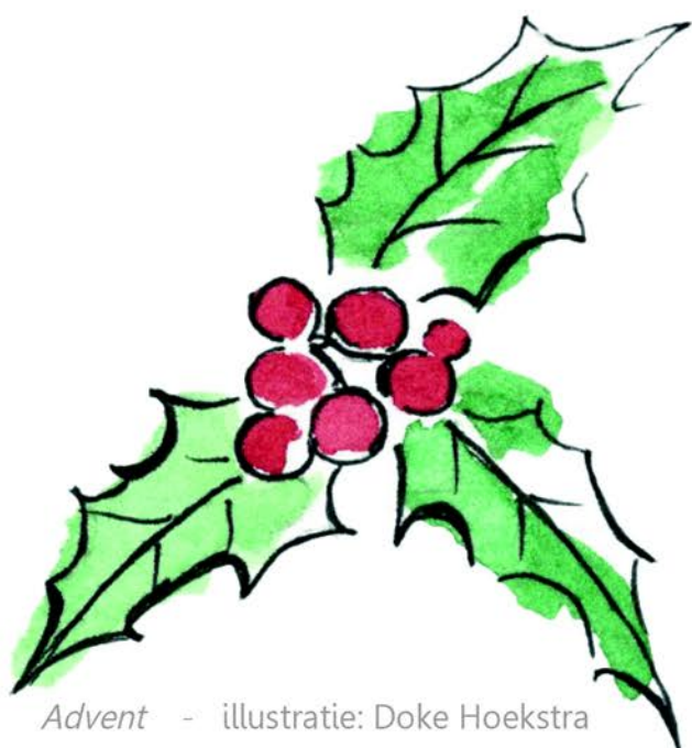
Advent - illustratie: Doke Hoekstra